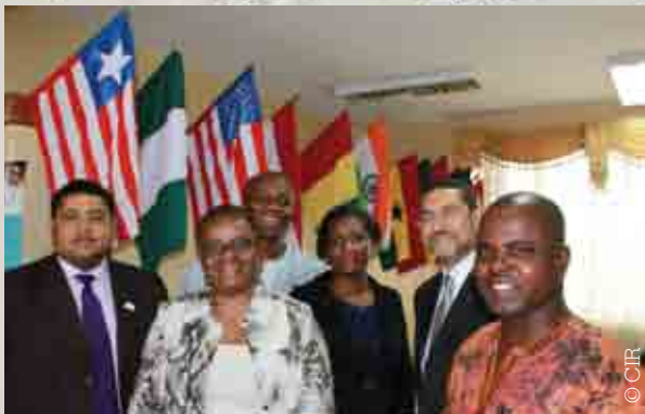
Intégration du secteur privé – rencontre entre les représentants de la Banque africaine de développement, du CIR et de la Chambre de commerce

Il a fallu réunir toutes les parties intéressées pour édifier les bases d'un commerce qui serve le Libéria, et en particulier les communautés pauvres.